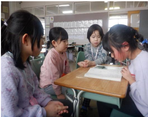
1年生から教科書を使って 読み聞かせをしてもらいました。

タブレットを使って勉強していたよ。縄跳びも上手だし、6年生は すっごく大きかったあ〜 等々と目を輝かせて話してくれ、ここには 載せられない位の事を話してくれました。