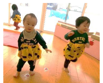
今年の鬼さんかわいいね！